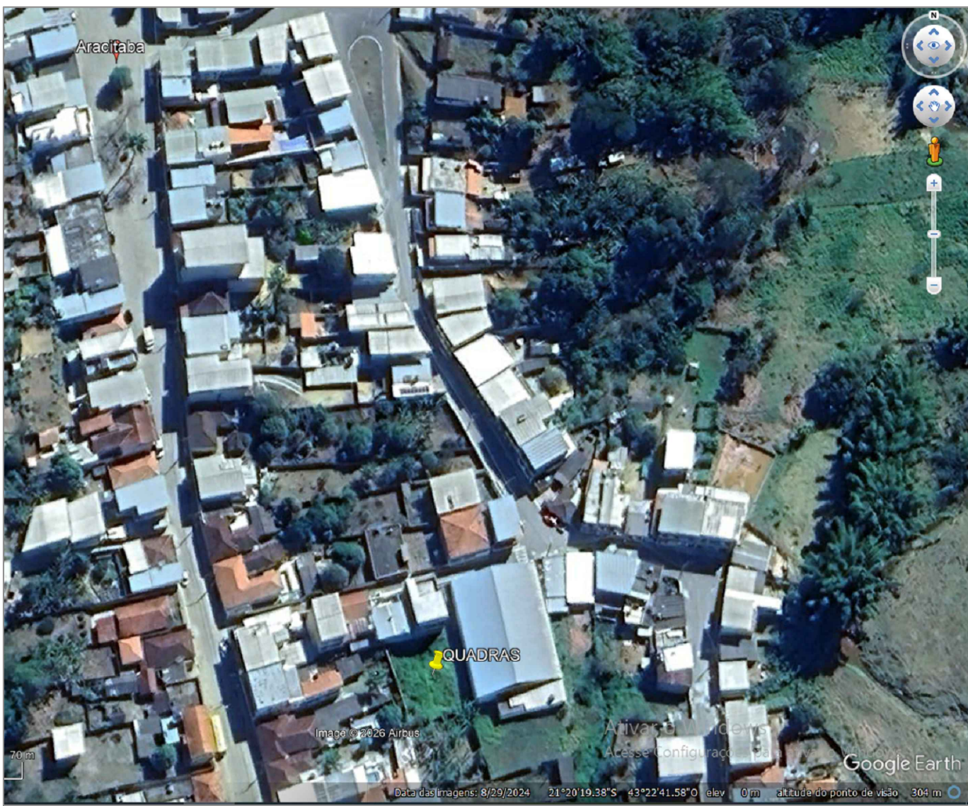
PLANTA DE LOCALIZAÇÃO - GOOGLE EARTH ESC. 1/100